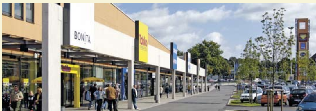
Sterkrader Tor, Oberhausen