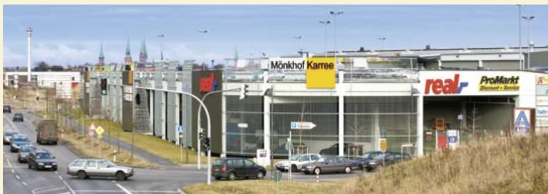
Mönkhof Karree, Lübeck